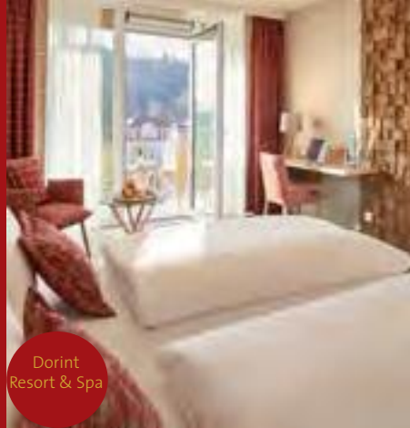
Dorint Resort & Spa

222 Betten: im EZ Ü/F ab 99,00 €; Ü/VP ab 151,00 € im DZ p. Pers./Nacht Ü/F ab 54,50 €; Ü/VP ab 106,50 €; Dorint GmbH, Dorint Resort & Spa, Heinrich-von-Bibra- Straße 13, 97769 Bad Brückenau, ☎ 0 97 41/ 850 www.dorint.com/bad-brueckenau