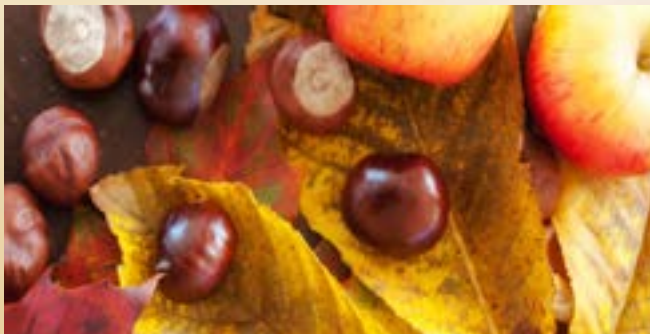
4 Das königliche KLEINOD Bayerns.

Die Verwendung von abgedruckten Terminen, Texten, Bildern und Anzeigen ist nur mit schriftlicher Genehmigung des Bayerischen Staatsbades Bad Brückenau gestattet.